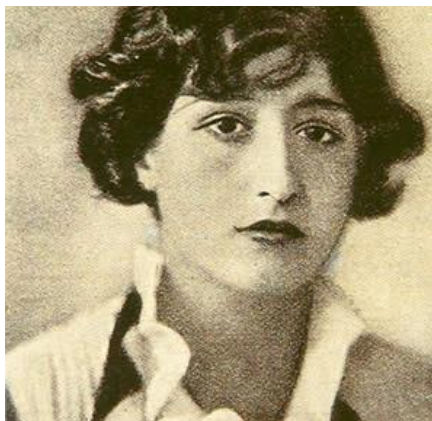
(Retrato de Maruja Mallo)

En la década de los 60 vuelve a España. Murió en Madrid, en 1995.